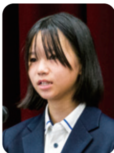
基準 「土曜日の讚美歌」