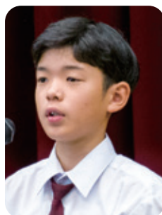
3番 「ぼくもボランティアに なれる」