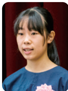
1番 「言語の壁を 乗り越えて」