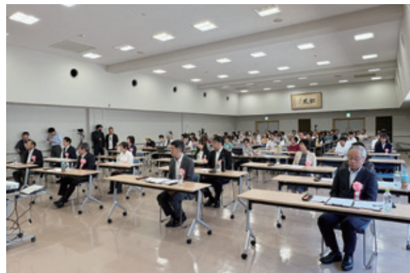
審査委員・会場風景