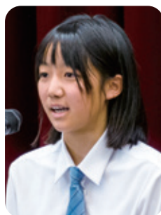
5番 「私の心の第一歩」