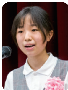
7番 「おばあちゃん ~あげたもの・もらったもの~」