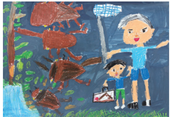
じいちゃん 덕분에カブト虫をつかまえたよ