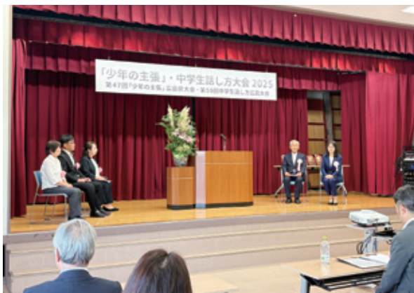
主催者及び来賓登壇