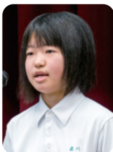
4番 「救える命 守れる笑顔」