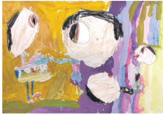
おやすみのひにかぞくであそんでいるところ。