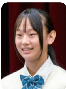
2番 「心があたたかく なるとき」