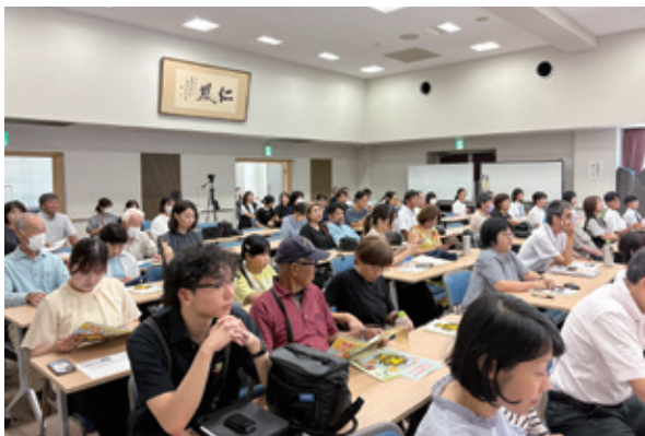
大会開始前の会場