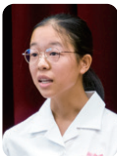
6番 「私たちの手で 自然を守る」