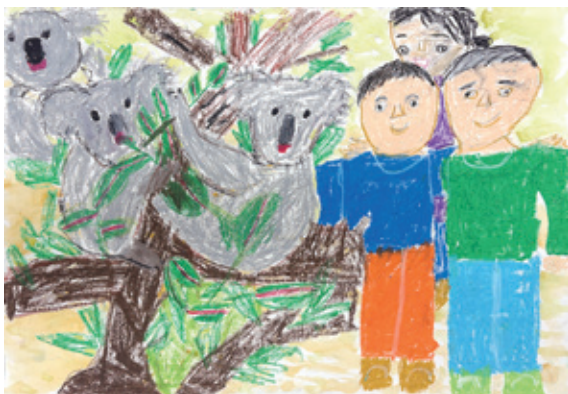
コアラの家ぞくとぼくたち家ぞくで遊んだよ