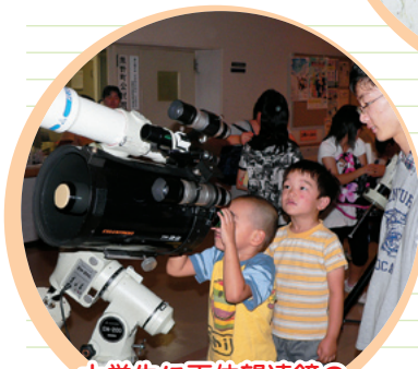
大学生に天体望遠鏡の 使い方を教わる子どもたち