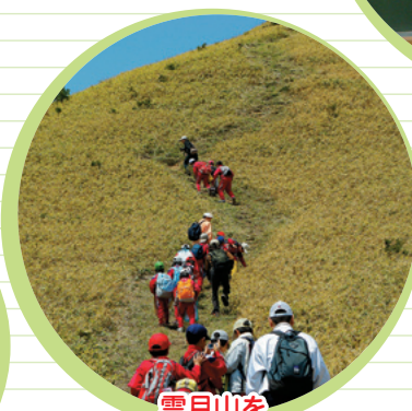
雲月山を フィールドワークする一行