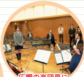
広響の楽団員に 夢を伝える応募者