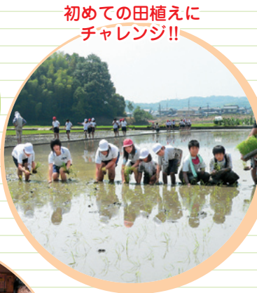
初めての田植えに チャレンジ!!