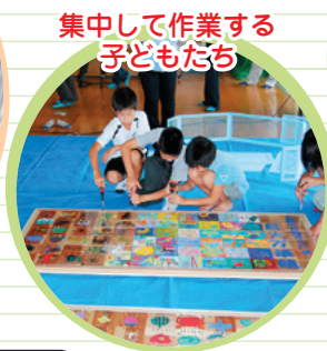
集中して作業する 子どもたち