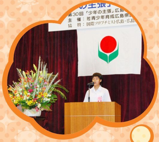
P7 中学生による 「少年の主張」広島県大会