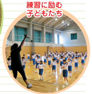
練習に励む 子どもたち