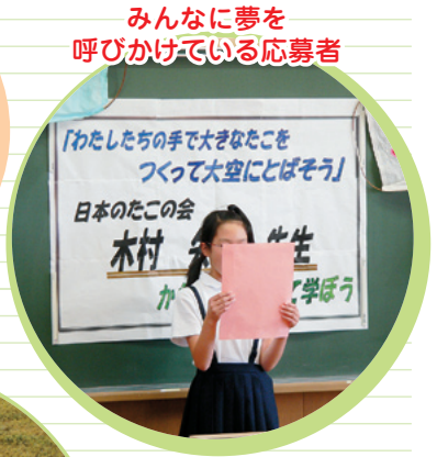
みんなに夢を 呼びかけている応募者