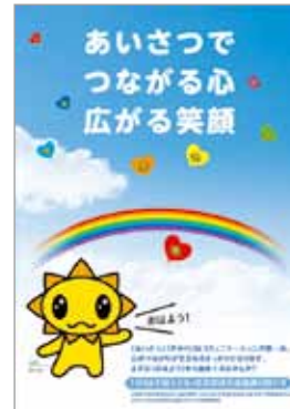
「子ども・若者育成支援強化月間」