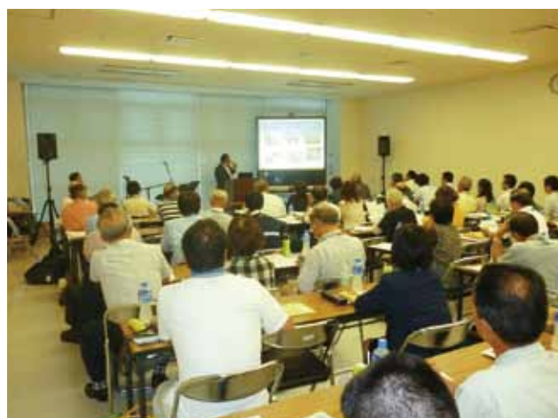
平成25年度 東広島市で開催時の風景