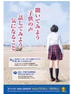
「青少年の非行・被害防止 全国強化月間」 キャンペーンポスター