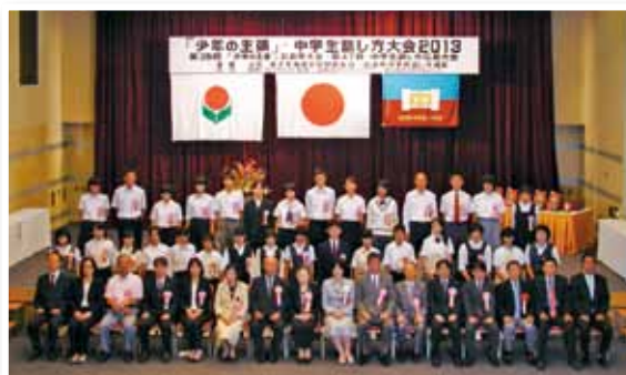
当日発表された皆さん

会場 エソール広島 (広島市中区富士見町11-6 TEL.082-242-5252)