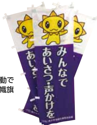
あいさつ・声かけ運動で ひときわ目を引く幟旗